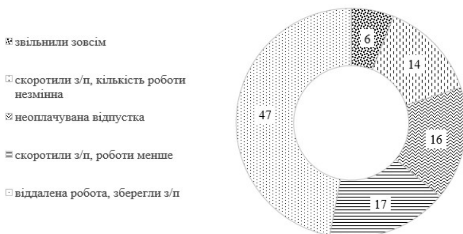
Рис. 1. Результати анкетування 99 компаній України про поведіння з персоналом у травні 2020 р. у зв'язку з пандемією COVID-19 , %