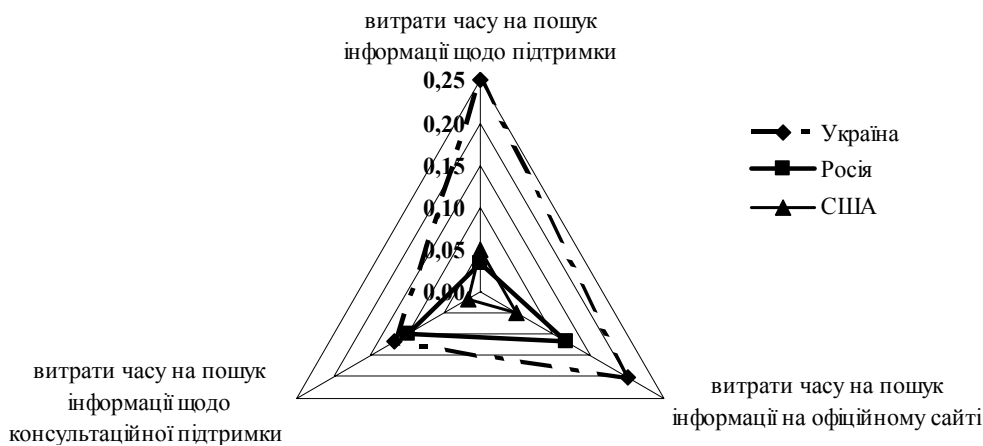
Рис. 2. Витрати часу на пошук інформації щодо підтримки малого підприємництва в мережі Інтернет у деяких країнах, годин

Розглядаючи витрати пошуку інформації щодо підтримки суб'єктів підприємництва, порівнюємо витрати часу на пошук інформації за запитами в мережі Інтернет у різних країнах (рис. 2). Можна констатувати, що пошук інформації в Україні дуже затратний за часом, навіть у порівнянні з Росією.