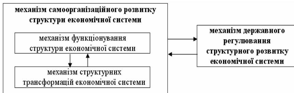
Рис. 1. Основні підсистеми механізму розвитку структури економічної системи

Визначені особливості механізму розвитку структури економічної системи дозволили виділити його основні складові (рис. 1). Механізм розвитку структури економічної системи представлено як взаємодію механізму самоорганізаційного розвитку структури економічної системи та механізму її державного регулювання.