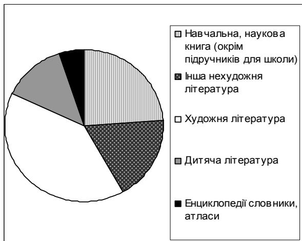
Рис. 4. Результати опитування "Яку книгу ви купували останнього разу?"

У 2007 р. книги і брошури в Україні видавалися 23 мовами світу. Українською мовою було видано 11825 назв видань (65.7 %) сукупним тиражем 28.8 млн примірників (51.3 %), а російською мовою – 4639 назв видань (25.8 %) сукупним тиражем 24.5 млн примірників (43.6 %). У 2007 р. порівняно з 2006 зменшилося видання книг українською мовою на 1269.9 тис. примірників, а їх частка зменшилася з 55.4 % до 51.3 %. Одночасно збільшилося видання книг російською мовою на 4462 тис. примірників, їх частка у 2007 р. становила 43.6 % проти 36.9 % у 2006 р. Для порівняння, у 2004 р. частка видань українською мовою становила 67.7 %, а російською – 26.6 % [7].