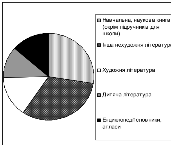
Рис. 3. Випуск книжкової продукції у 2005 р. за цільовим призначенням

У свою чергу в Україні спостерігається значний попит на художню літературу. За результатами маркетингового дослідження, проведеного компанією GfK Ukraine у 2005 р., серед книг, які купують громадяни, частка художньої літератури майже 40 %. На другому місці навчальна та наукова література – 24 %, книги для дітей – 18 % [9]. Порівняння випуску книжкової продукції та попиту на неї дозволяє виявити невідповідність: найбільше видається книжкової продукції навчальної та наукової тематики, а найбільший попит на художню літературу (рис. 3–4).